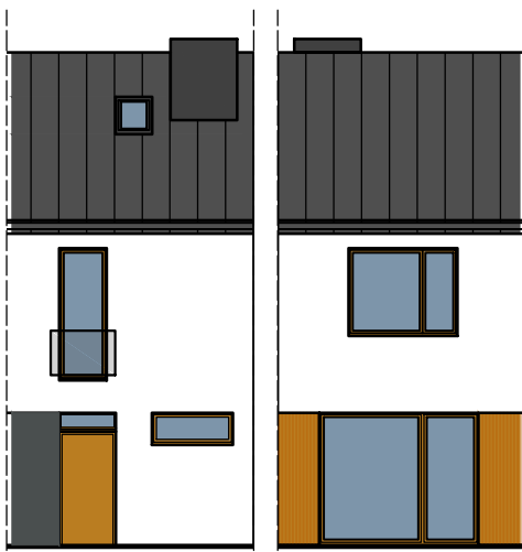
ELEWACJA FRONTOWA ELEWACJA OGRODOWA